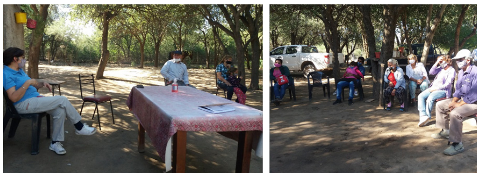
Reuniones presenciales realizadas con las/os representantes de los proyectos de la MC

En la mayoría de las reuniones es el Director General de Agencias Zonales y Desarrollo Territorial o, en su defecto, algún representante de la UEP PRODECCA, quienes asumen la tarea de coordinar las reuniones, teniendo como principal objetivo enmarcar el trabajo, proponiendo los temas a tratar y las modalidades para facilitar la participación de todos los actores.