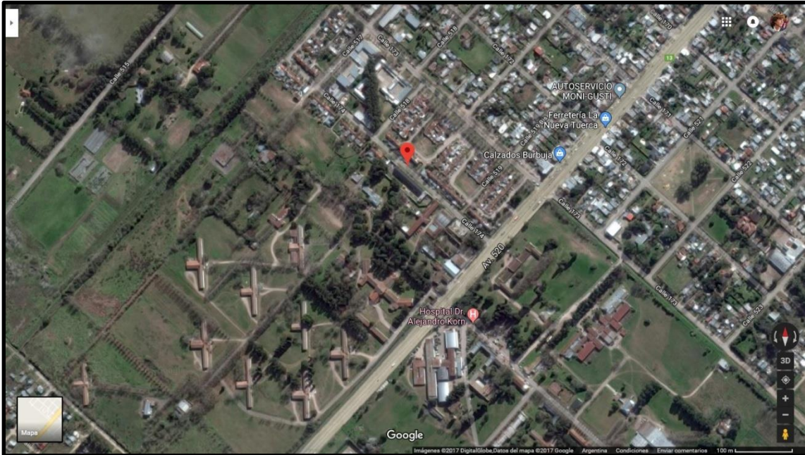
Figura 2: Ubicación del predio en calle 174 entre 518 y 519, localidad de Melchor Romero