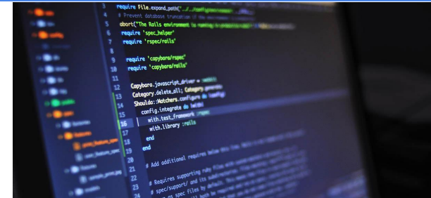
SOFTWARE Y ECONOMÍA DEL CONOCIMIENTO

En la provincia está instalada la empresa Parque Eólico Arauco SAPEM es una empresa mayoritariamente estatal que abastece de energía limpia a más de 87 mil hogares.