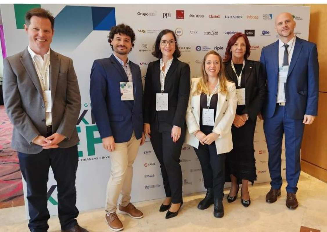
El equipo técnico de la CNV en la Expo EFI

El objetivo fue acercar a los asistentes los instrumentos disponibles en el mercado de capitales para el financiamiento PYME, con especial foco en aquellos autorizados por la CNV y la descripción de las condiciones de mercado para su emisión.