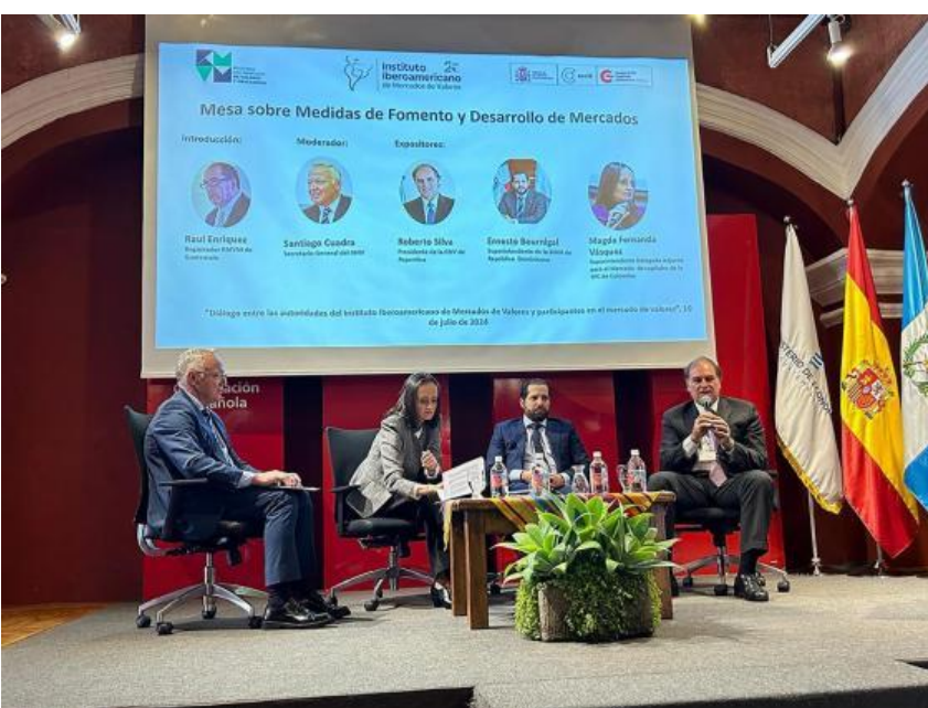
El Presidente de la CNV, Roberto Silva exponiendo en la reunión del IIMB en Antigua, Guatemala

“Es intención de la actual conducción de la CNV estrechar los lazos con las autoridades regionales de los mercados de valores para continuar nutriéndose de las experiencias de las mismas”, dijo el presidente del organismo.