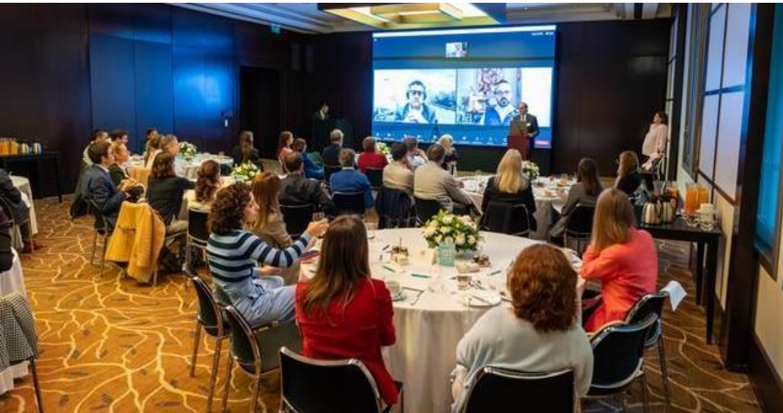
Silva exponiendo en Investment Stewardship & Disclosure

desarrollo, lo que es uno de los objetivos centrales de la gestión” y que “con la aprobación de Ley N° 25.246 se agregó a la agenda el registro de los proveedores de servicios de activos virtuales (PSAV) y la posterior alineación de la infraestructura regulatoria con los estándares internacionales, sobre todo conforme a los estándares de IOSCO y de la OCDE”. Por último, dijo que “trabajar en educación financiera e incorporar las mejores prácticas para incluir a nuevos inversores está entre nuestras prioridades”.