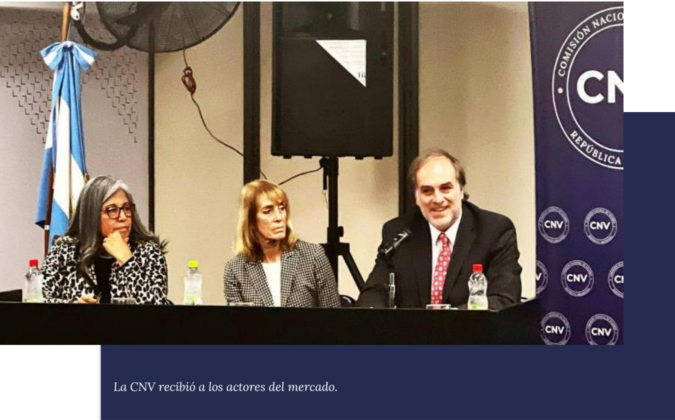
La CNV recibió a los actores del mercado.