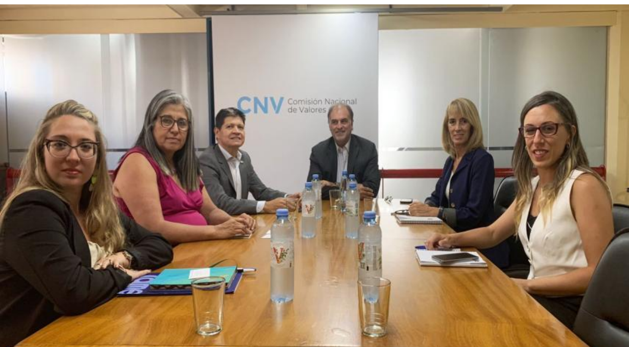
Encuentro de la CNV con la CAME