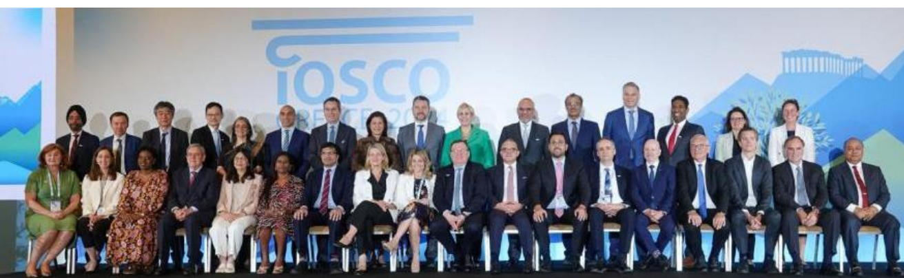
Nombramiento del Dr. Silva

Este nombramiento permite que Argentina vuelva a formar parte del órgano rector y normativo de IOSCO, compuesto por las autoridades reguladoras de valores de los principales mercados del mundo, y represente allí a sus pares de América del Norte, Centroamérica y Sudamérica.