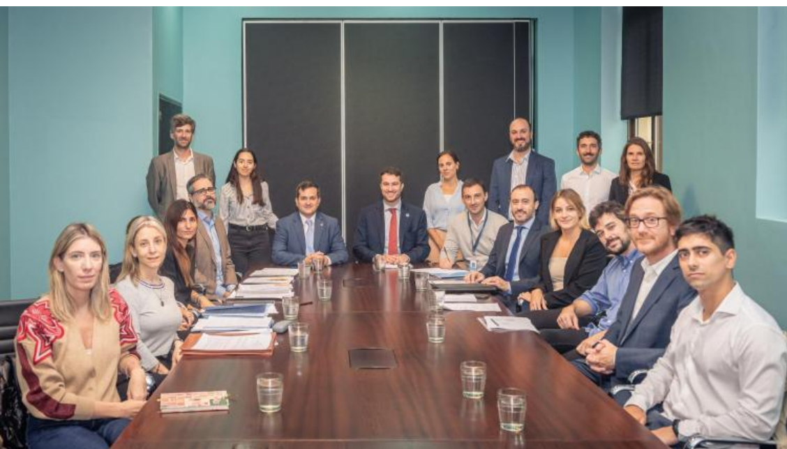
Reunión CNV, UIF y el sector PSAV

Autoridades de la Comisión Nacional de Valores (CNV) y de la UIF se reunieron con representantes del sector de proveedores de servicios de activos virtuales (PSAV), integrantes de la Cámara Argentina Fintech, a fin de aclarar incertidumbres respecto de la reciente reglamentación de la actividad del sector. Este encuentro se da en un marco de colaboración interinstitucional para el efectivo cumplimiento de la regulación a los PSAV.