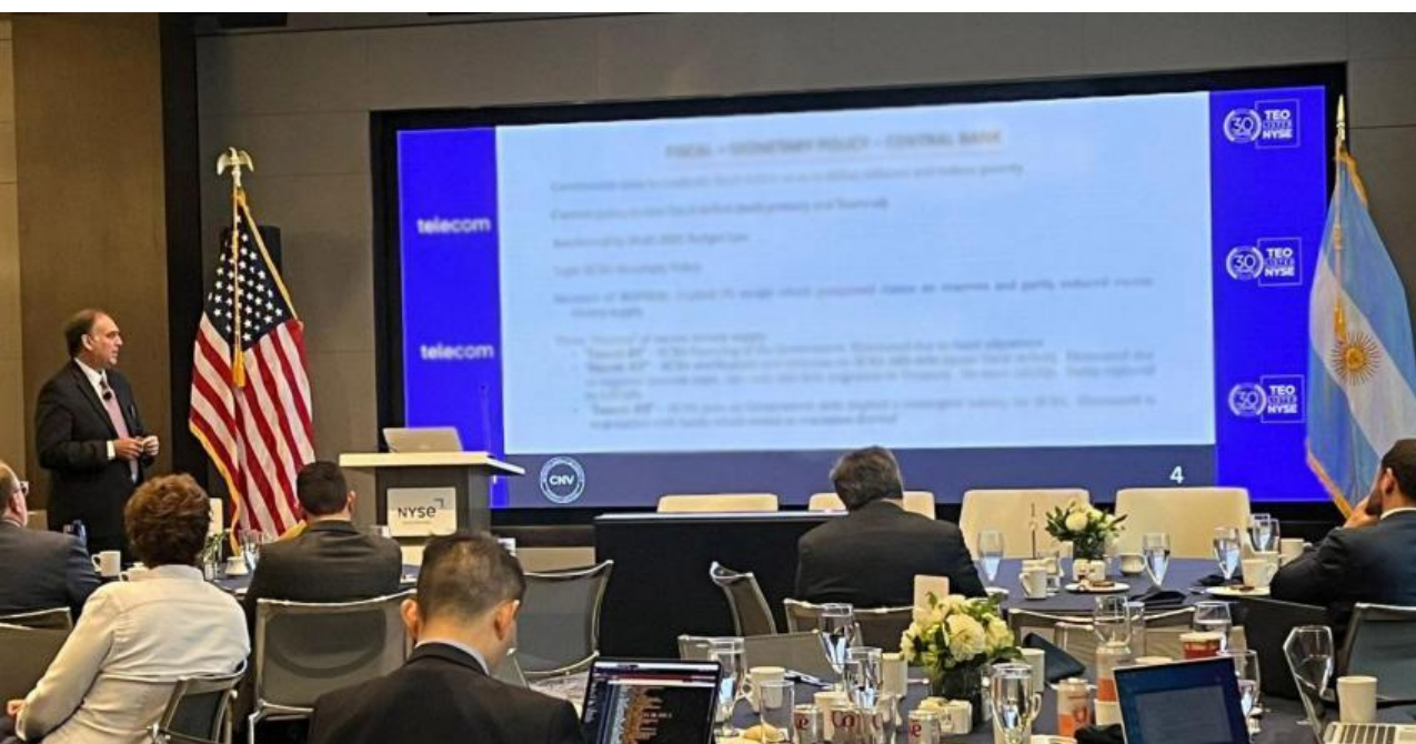
El Presidente Roberto E. Silva disertando ante inversores en la Bolsa de Nueva York.

Roberto E. Silva disertó en un Investor Day con inversores en la Bolsa de Nueva York (NYSE). Durante la jornada y con el objetivo de atraer nuevas inversiones, el presidente de la CNV expuso sobre las oportunidades de inversión en el mercado de capitales, brindó un panorama del marco legal impulsado por el gobierno nacional para inversiones, incluyendo el Régimen de Incentivo a las Grandes Inversiones (RIGI).