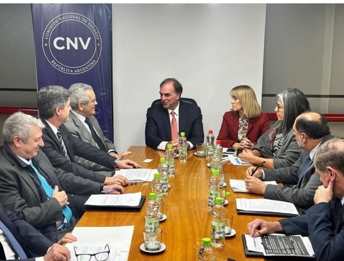
Reunión con la SIGEN

Durante el encuentro, se presentaron las nuevas autoridades de ambos organismos, y conversaron sobre los principales hallazgos surgidos del Informe de Entrega y Recepción realizado en cumplimiento del Decreto N° 126/2023, exponiendo la situación de la CNV al momento del cambio de administración, producida en diciembre de 2023.