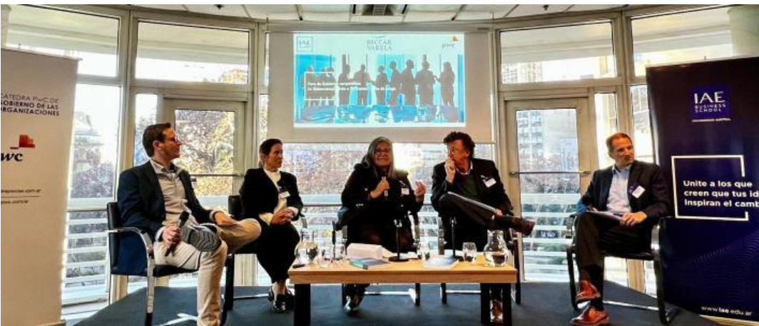
La Doctora Salvatierra en evento de IAE Business school.

La Dra. Salvatierra destacó que “ingresar al mercado de capitales es salir al mundo, organizarse, ordenarse, compilar información, difundirla y ser transparentes. En definitiva, generar un valor adicional”. Resaltó además que “el objetivo central de la gestión del directorio de la CNV, es el desarrollo del mercado de capitales. Para ello, trabajamos en la agilización de procesos, simplificación normativa, y generación de nuevas oportunidades. Queremos que las empresas obtengan financiamiento alternativo de manera fácil y accesible, y que se animen a pasar del endeudamiento a la capitalización”.