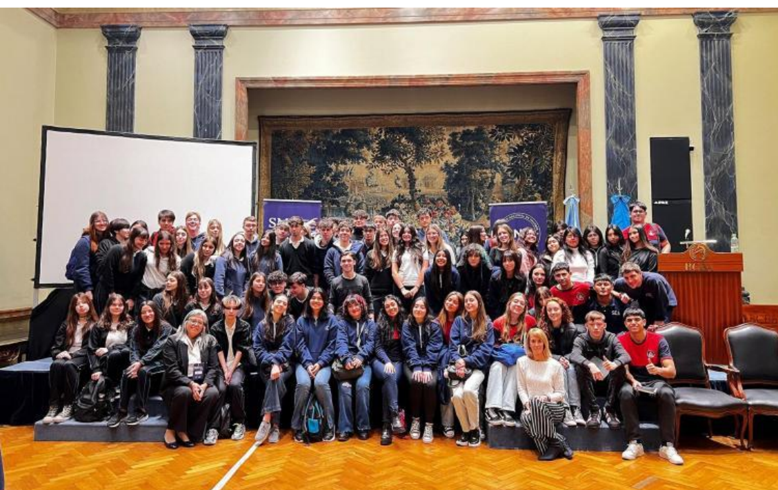
Más de 150 alumnos de colegios secundarios participaron de la SMI.

La CNV realizó una jornada sobre educación financiera con expertos y una propuesta recreativa, en sintonía con el lema de la SMI “Hacia un mercado eficaz y transparente”, destinada a más de 150 estudiantes de secundaria.