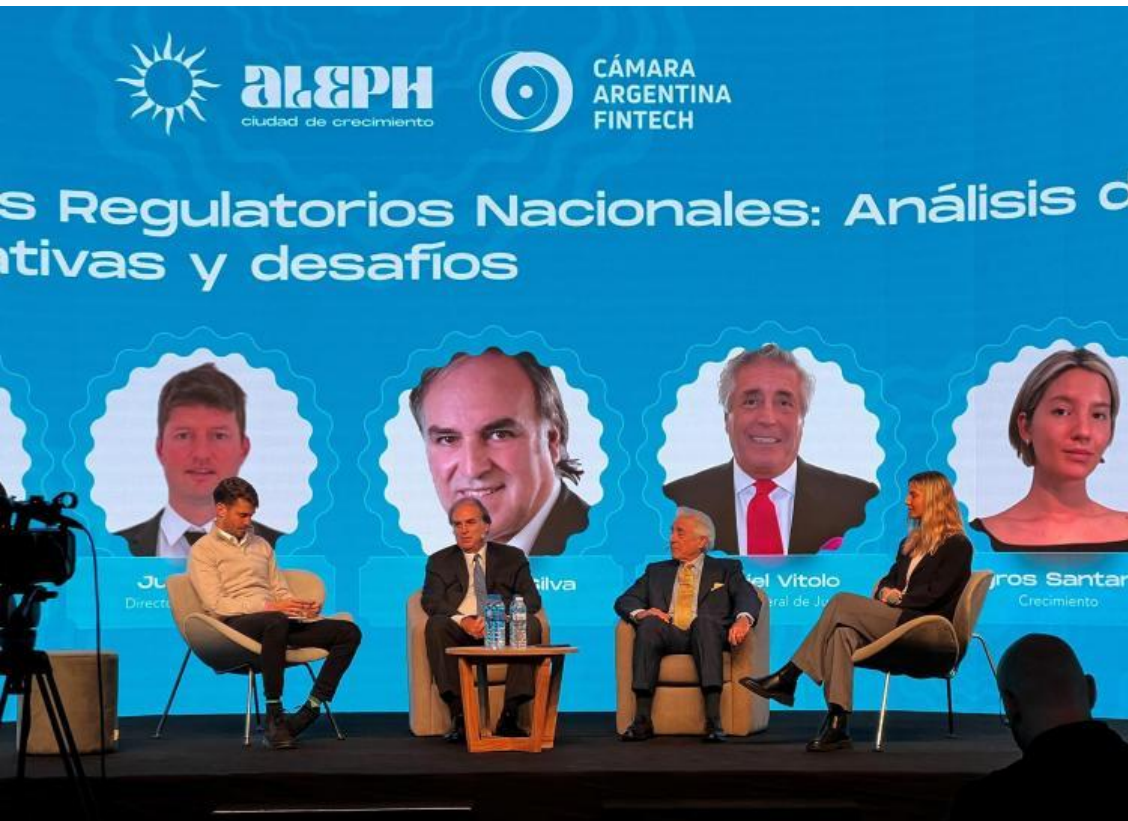
El Dr Silva en el panel sobre Marcos Regulatorios Nacionales

“Con el mandato que nos da la Ley N° 27.739, nos encontramos trabajando en la regulación y supervisión de los PSAV. Estamos a favor de la tecnología y de la innovación. No queremos sobrerregular la industria, pero vamos a cumplir con la Ley”, dijo el presidente de la CNV y agregó que, “en paralelo, estamos trabajando sobre tokenización”.