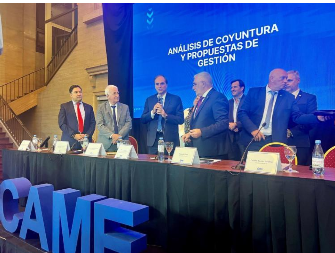
Firma del acuerdo con CAME

Las partes se comprometen a realizar actividades específicas para promover el aprovechamiento por parte de las Mipymes de los diversos instrumentos de financiamiento disponibles en el mercado de capitales. Para ello se organizarán talleres, encuentros regionales y capacitaciones conjuntas virtuales/presenciales, así como se brindarán asesoramiento técnico adecuado y soporte de un equipo de profesionales.