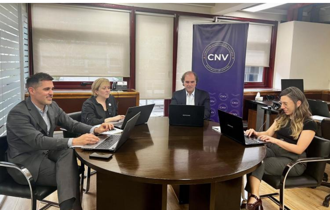
Reunión virtual con la SEC