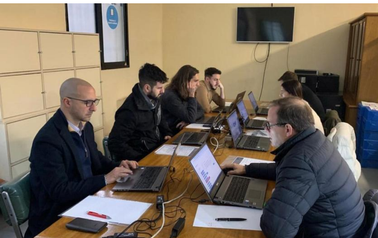
Se realizó el primer examen de idoneidad en las instalaciones de la CNV.