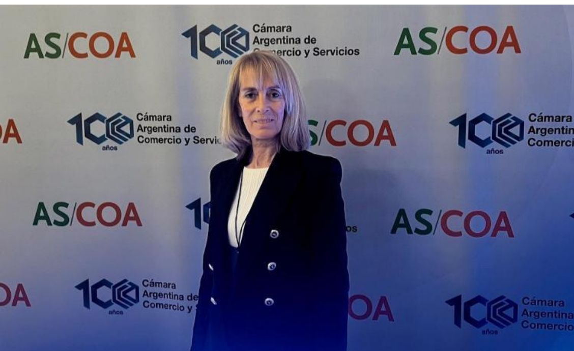
La Dra. Boedo en el Consejo de las Américas

“Celebramos estas instancias de encuentro público-privado donde se trabaja en pos de potenciar las inversiones y el desarrollo de nuestro país”, dijo la Dra. Boedo.