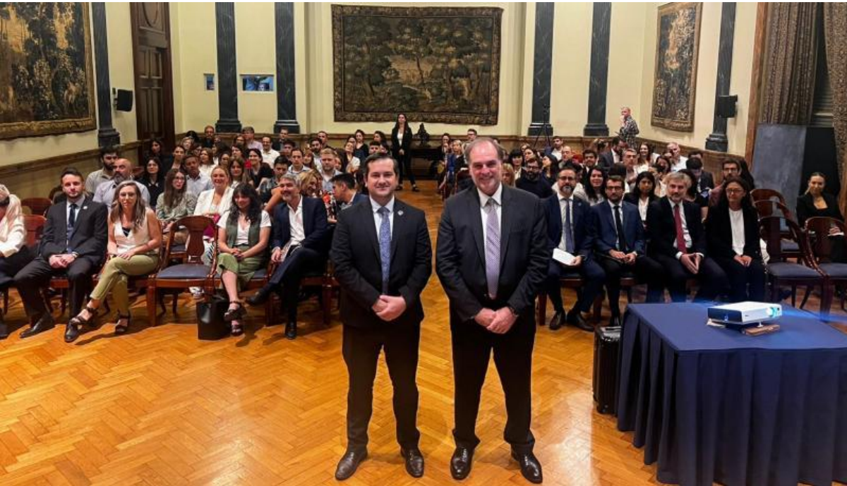
Roberto Silva, junto al presidente de UIF, Ignacio Yacobucci

El presidente de la Comisión Nacional de Valores (CNV), Roberto E. Silva, junto al titular de la Unidad de Información Financiera (UIF), Ignacio Yacobucci, realizaron la apertura de la jornada de capacitación en regulación de criptoactivos para el personal de ambos organismos.