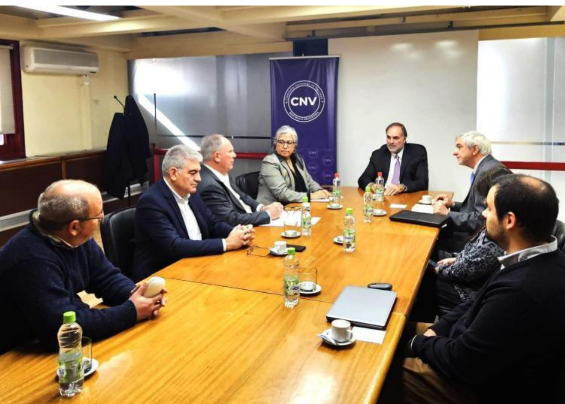
Reunión con el Secretario de Minería de la Nación