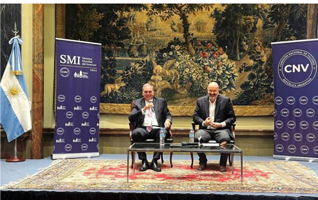
El ministro compartió el panel “Desregulación y Mercado de Capitales” con el presidente de la Comisión Nacional de Valores (CNV), Roberto E. Silva.

La segunda parte de la jornada de apertura de la Semana Mundial del Inversor, realizada en la Bolsa de Comercio de Buenos Aires, contó con la presencia del ministro de Desregulación y Transformación del Estado, Federico Sturzenegger.