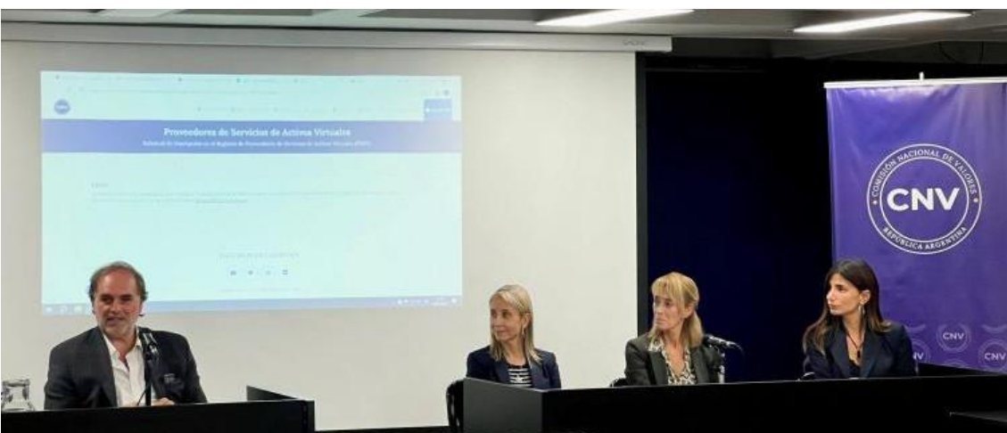
El directorio de la CNV recibió a representantes de los principales estudios jurídicos del país y a miembros de la cámara Fintech

La CNV continuará con encuentros y mesas de diálogos con diferentes actores del sector para evacuar dudas e intercambiar visiones sobre la implementación de la norma, que tendrá dos momentos: un primer momento de registro y un segundo momento donde se evaluará una posible regulación, supervisión y eventual licencia, como lo indica la Ley sin perjudicar a la industria.