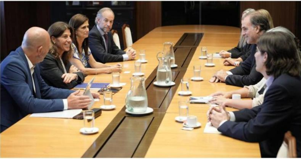
Encuentro con la AFIP