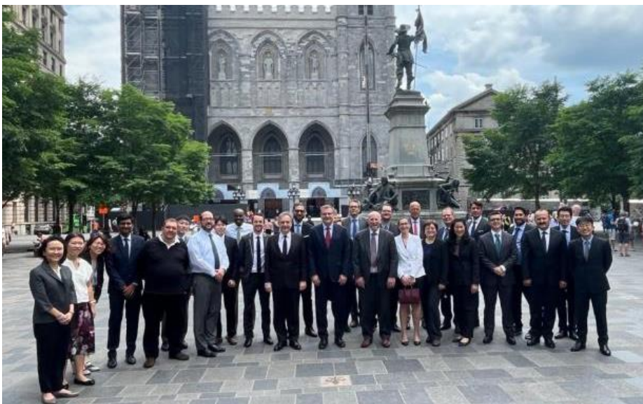
Evento de IOSCO sobre temas contables

La Comisión Nacional de Valores participó del encuentro del Comité 1 sobre Contabilidad de Emisores, Auditoría y Divulgación de Información de la Organización Internacional de Comisiones de Valores (IOSCO, por su sigla en inglés), celebrado en Montreal, Canadá.