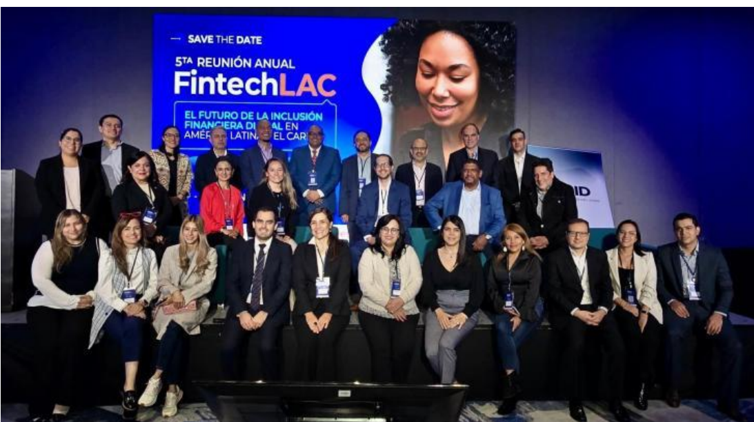
El Dr. Silva en FintechLAC

El Dr. Silva resaltó la importancia que el organismo mantenga una participación activa en el Comité Ejecutivo del FintechLAC, teniendo en cuenta el rol del organismo, como regulador de los Proveedores de Servicios de Activos Virtuales, mandato que le otorgó la Ley N° 27.739, modificatoria de la Ley N° 25.246 de Prevención del Lavado de Activos, el Financiamiento del Terrorismo y la Proliferación de Armas de Destrucción Masiva. En este sentido, destacó que “en Argentina, ya se avanzó en la registración de los proveedores de servicios de activos virtuales” y que “para la segunda etapa de supervisión y regulación, estos espacios de intercambio y enriquecimiento mutuo serán de gran ayuda, ya que permitirán elaborar una reglamentación que esté acorde a las mejores prácticas internacionales, sin que esto signifique un obstáculo para la industria”.