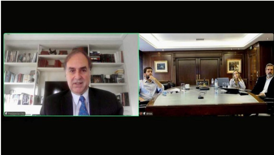
Silva en el “Investor Day” de ByMA

“En lo que concierne a los mercados, hemos trabajado en varias RG para facilitar la operatoria. Entre ellas hemos impulsado normativa sobre QCCP, opciones sobre índices y T+1, que nos pone a la vanguardia junto a los mercados del mundo”, destacó.