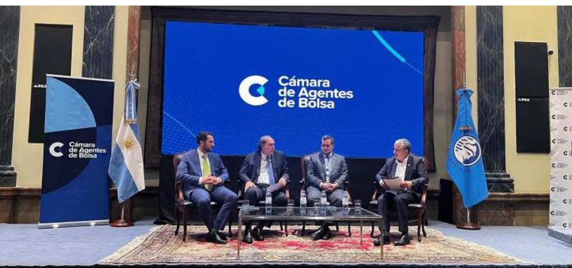
La CNV y la UIF en la jornada sobre el impacto de la reforma de la Ley de Prevención de Lavado de Activos en el Mercado de Capitales.