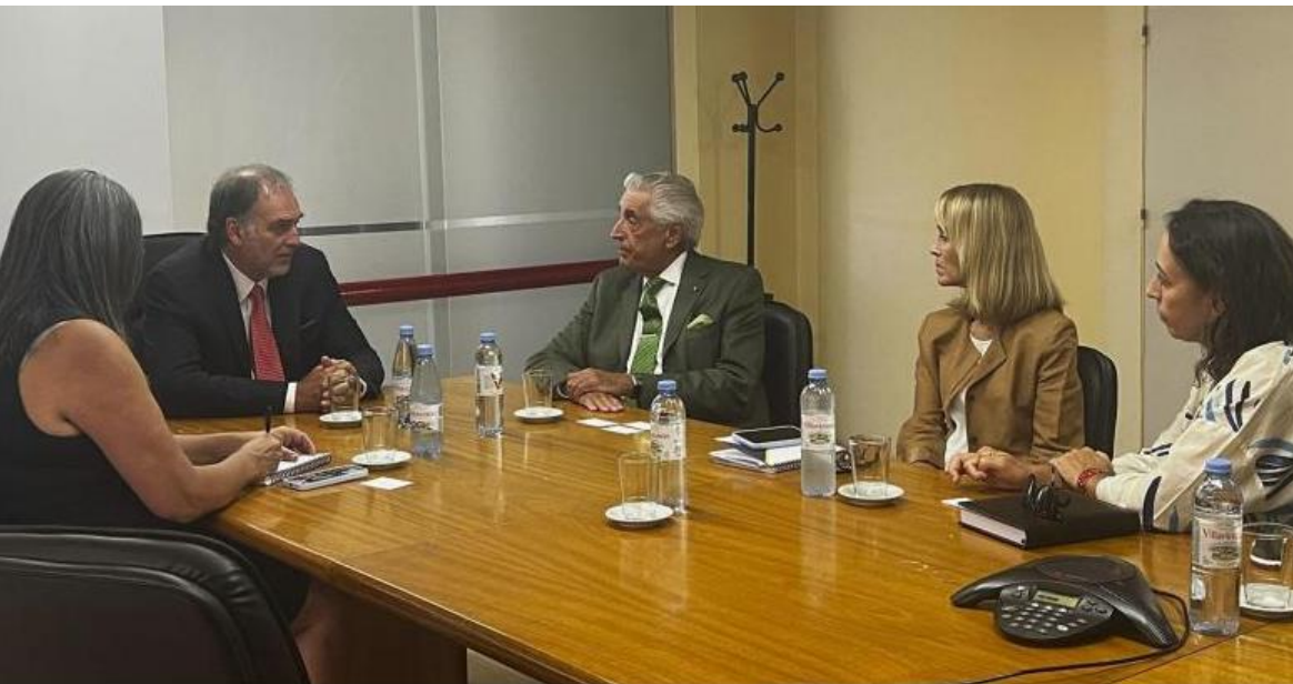
Encuentro de la CNV con la IGJ

La reunión tuvo como eje principal la necesidad de resolver y agilizar los trámites administrativos que requieren de tratamiento coordinado como impulsar la digitalización.