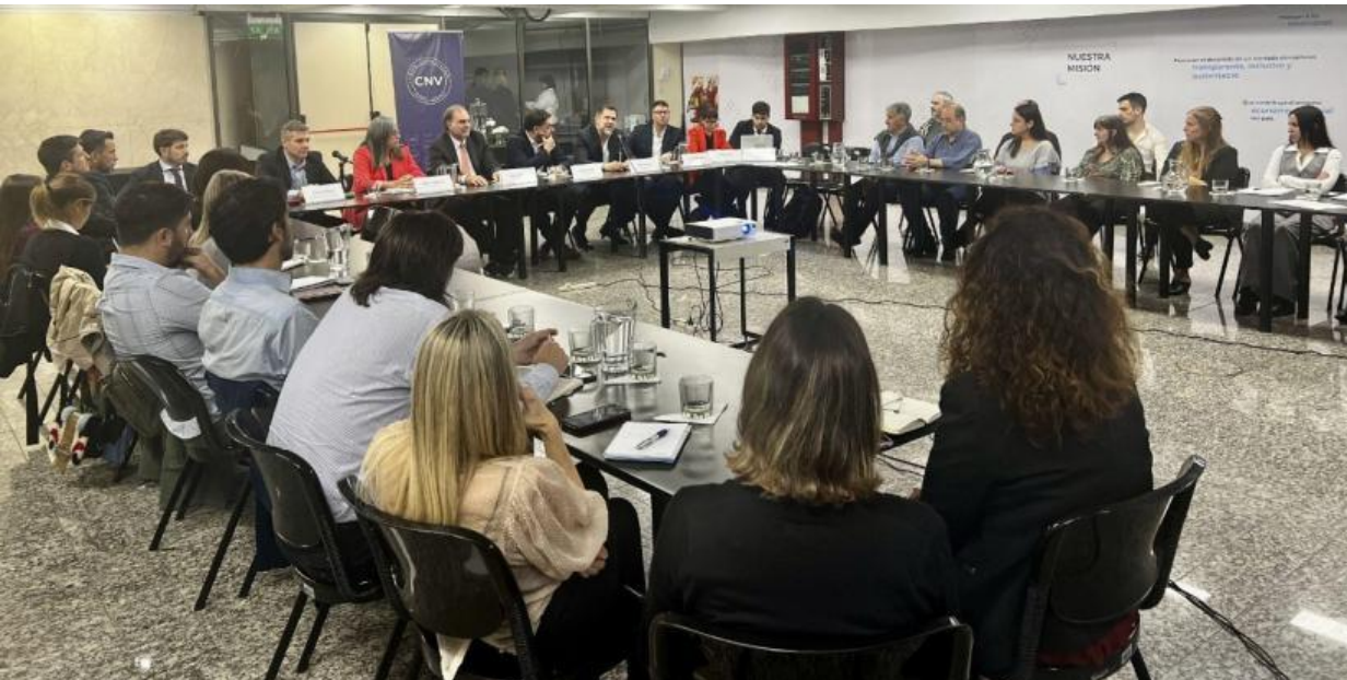
Jornada sobre ciberdelito en la CNV

En el marco de la reciente creación del registro de PSAV y del mandato que la Ley N° 25.246 da a la CNV, el Directorio impulsó una jornada participativa sobre ciberdelito con el objetivo compartir e intercambiar conocimientos entre el Poder Ejecutivo y el Poder Judicial en materia de supervisión y monitoreo de proveedores de activos virtuales.