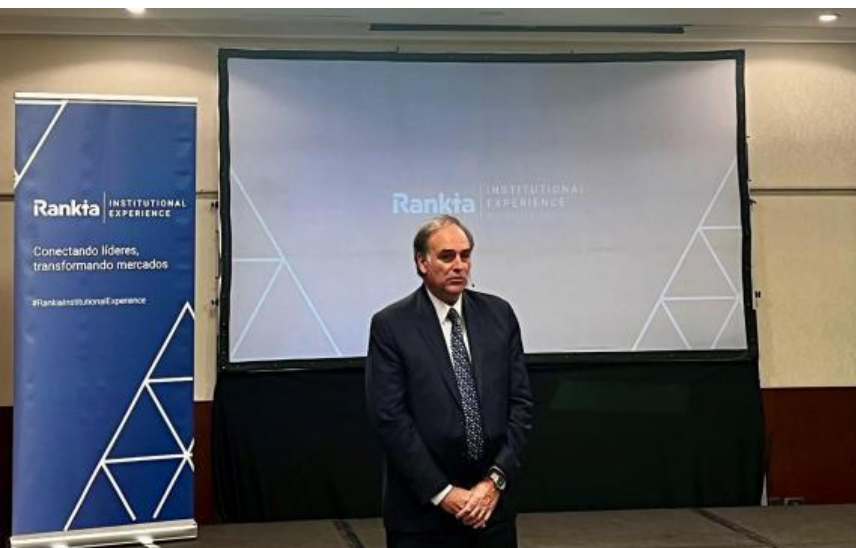
Silva inauguró el evento de Rankia Institucional Experience

Rankia Institucional Experience Buenos Aires 2024, en su primera edición contó con la ponencia del presidente de la Comisión Nacional de Valores (CNV), Roberto E. Silva, en su sesión inaugural.