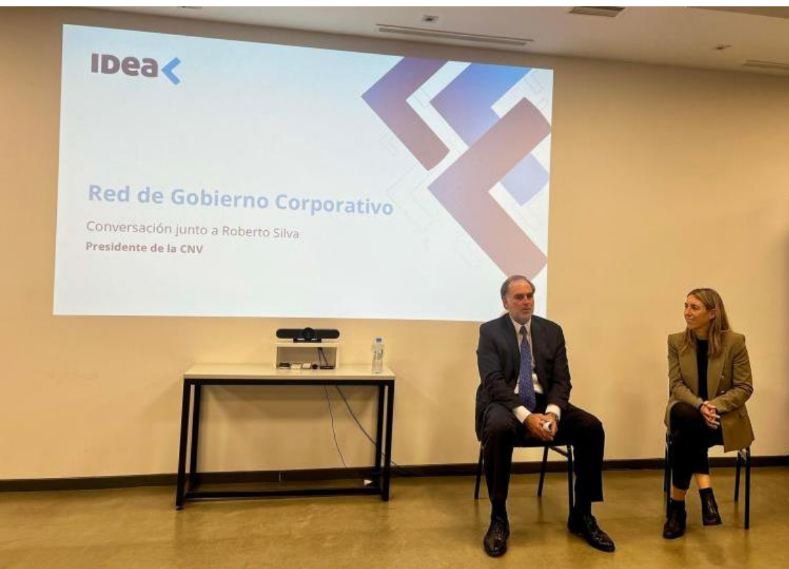
Silva participando del encuentro organizado por la Red de Gobierno Corporativo de IDEA

La agenda y las nuevas normativas adoptadas por la Comisión Nacional de Valores (CNV) estuvieron presentes en la disertación de su presidente, Roberto E. Silva, invitado por la Red de Gobierno Corporativo del Instituto para el Desarrollo Empresarial de la Argentina (IDEA).