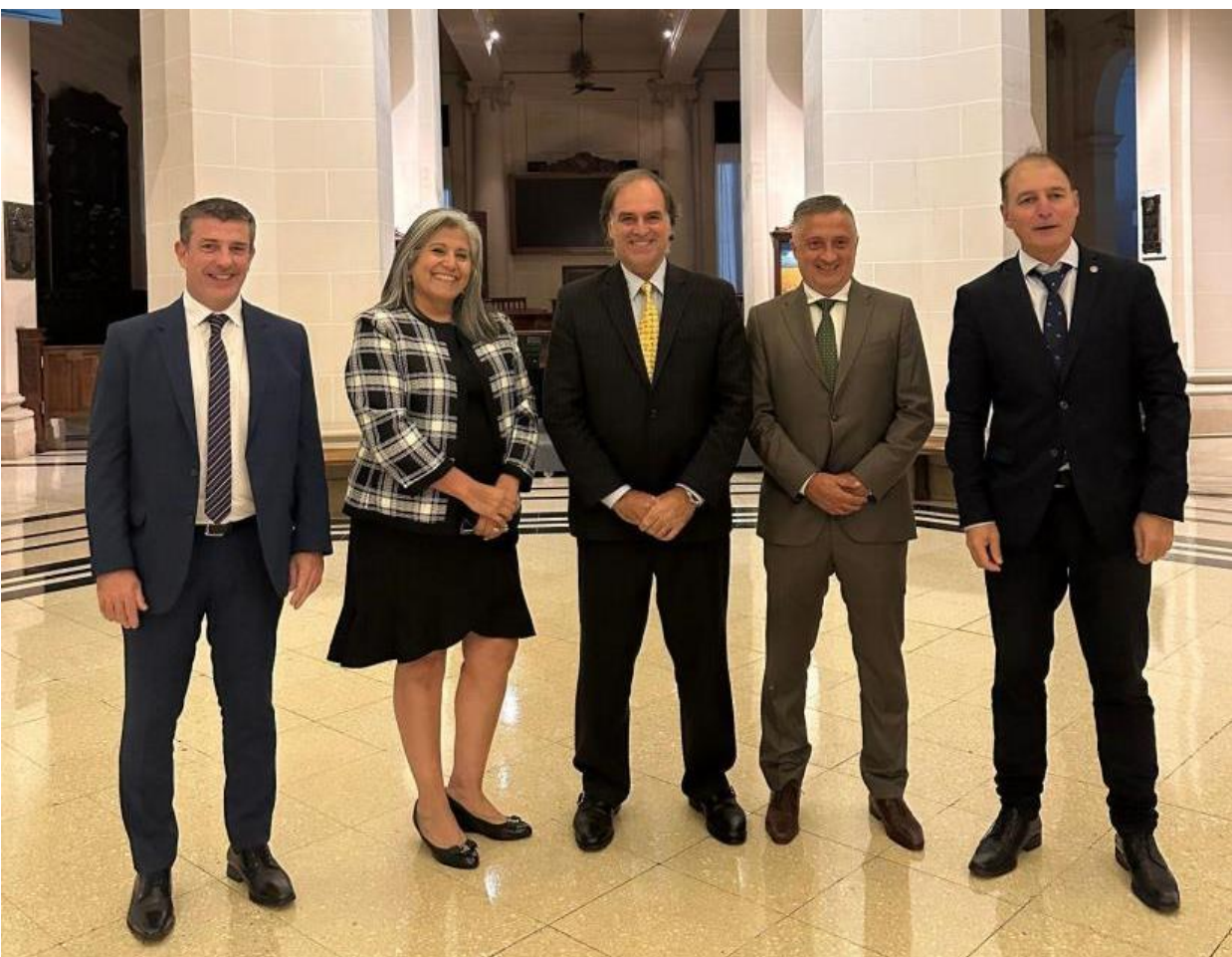
Autoridades de la CNV en la Bolsa de Comercio de Rosario