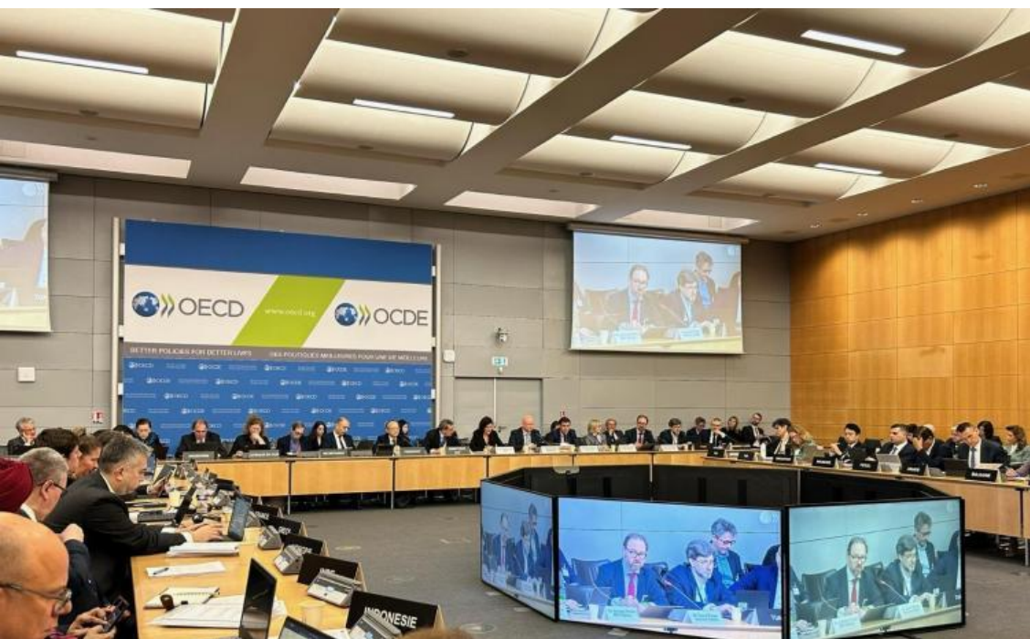
Reunión del Comité de Gobierno Corporativo de la OCDE

El presidente de la Comisión Nacional de Valores (CNV), Roberto E. Silva, participó en la 47ª Reunión del Comité de Gobierno Corporativo de la Organización para la Cooperación y el Desarrollo Económicos (OCDE), realizada en París el 8 y 9 de abril pasados.