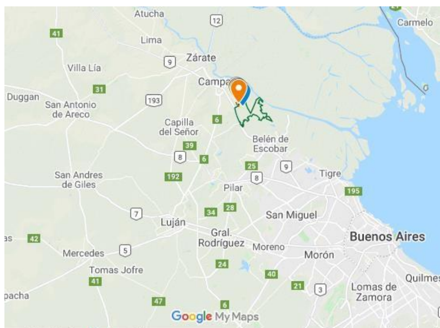
Figura 1: Ubicación del PNCP

Se entiende al voluntariado como una actividad sin fines de lucro, socioeducativa, que expresa valores de solidaridad individual y colectivos y con el objeto de