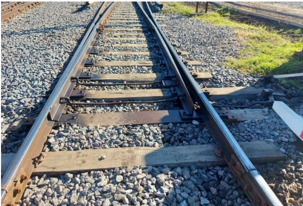
Ilustración 2. Estado actual.