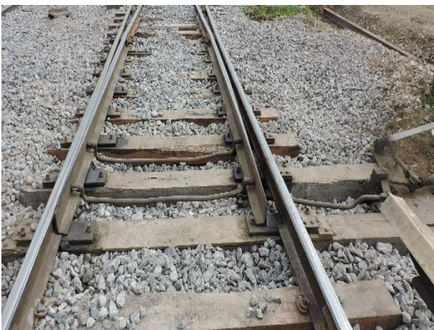
Ilustración 3. Estado al día 1/10/21

Se observó que, si bien el aparato de vía no fue reemplazado (es claro al poner en comparación ilustración 2 y 3), el mismo fue reacondicionado (según consta en informe de obra). Se evidenció una lubricación de los componentes del mecanismo.