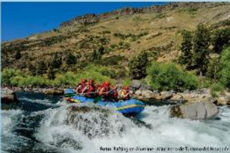
Rafting en Alumine

A tan sólo 25 km de Alumine se puede visitar un pintoresco espejo de agua de 1,3 km 2 llamado Roca Chorro. En el trayecto, bordeando el Río Chorro se encuentra la Laguna Lopez con su variedad de aves. Luego se transita por el Paraje Carrilín y la Comunidad Mapuche Algoñones donde se venden artesanías típicas. En invierno, a 65 km de Alumine, el Cerro Bates Mohuda, parque de nieve administrado por la comunidad Mapuche Puel permite disfrutar del paisaje, los bosques, miradas, montañas de nieve y muchas otras actividades.