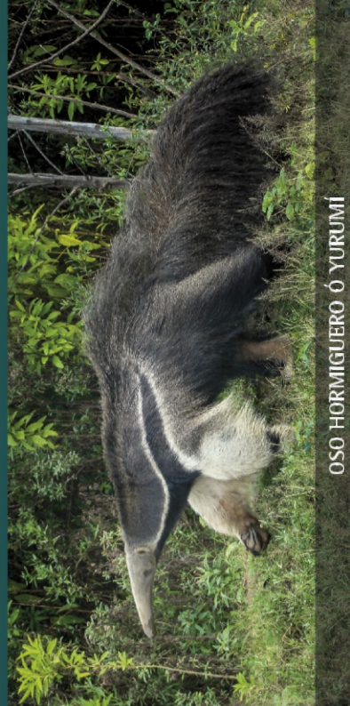
OSO HORMIGUERO Ó YURUMI