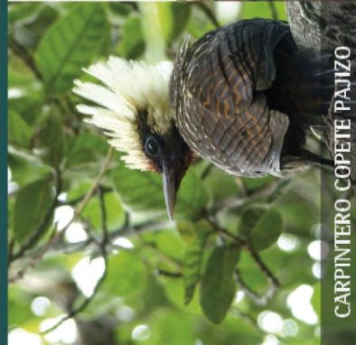
CARPINTERO COPETE PAJIZO