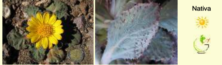
Familia Asteraceae Pachylaena atriplicifolia "oreja de chancho"

Arbusto espinoso mediano. Ramas rígidas, con hojas espinosas largas y otras hojas pequeñas, apretadas, sobre tallos cortitos. Flores blancas pequeñas. Una de las plantas más comunes de la estepa.