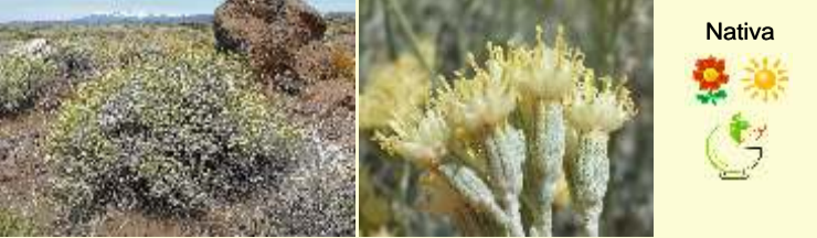
Senecio filaginoides "charcao gris, mata mora"

Arbustito enano en matas circulares, con tallos densamente hojosos. Hojas alternas, crasas, profundamente divididas, con segmentos terminados en punta. Flores amarillas en capítulos discoides, solitarios en los extremos de las ramas. Es común en suelos arenosos en la base del cerro Mellizo Sur.