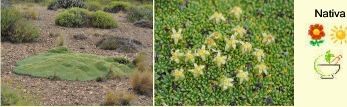
Familia Apiaceae Azorella monantha "yareta, leña de piedra"

Arbusto 2-3 m de altura, de hoja caduca, con ramas largas espiniformes y ramitas cortas que llevan varias hojas de borde ondulado. Flores femeninas y masculinas en pies separados. Es común en la estepa, solitario o formando bosquetes.