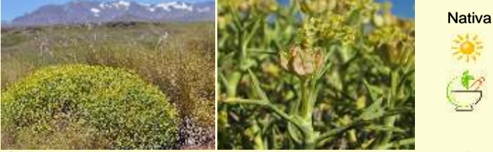
Mulinum spinosum "neneo"

Arbusto muy compacto que forma carpetas duras a ras del suelo, resinoso. Hojas enteras, en rosetas muy apretadas. Flores hermafroditas, solitarias. Frutos amarillo-verdosos. Es común sobre los escoriales basálticos.