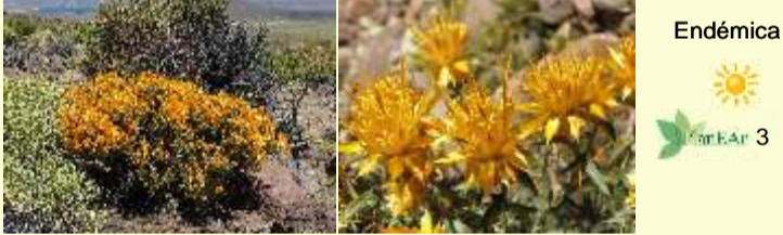
Familia Asteraceae Chuquiraga straminea "chuquiraga, grasa de yegua"