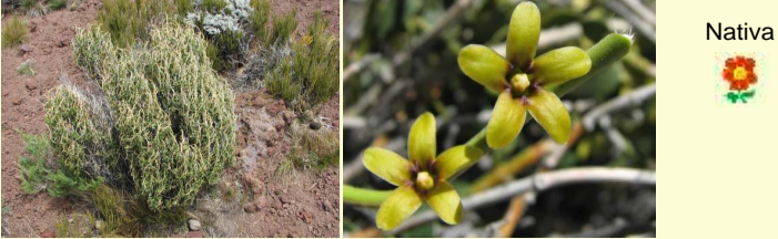
Familia Apocynaceae Diplolepis hieronymi "mata hedionda"

Cojines espinosos de hasta 1 m alt., laxos o compactos, aromáticos, amarillos o azulados. Hojas trilobuladas y punzantes, las viejas mueren y dan soporte a la planta. Flores en umbelas. Frutos alados. Es muy común en la estepa.