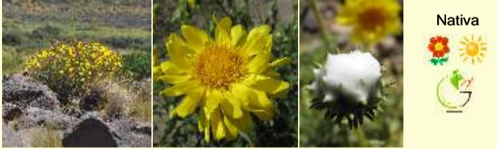
Grindelia chilensis "leche de yegua, melosa"

Arbusto espinoso de alrededor de 1 m alt., muy ramificado. Hojas rígidas, lanceoladas, terminadas en una espina y con dos espinas en la axila. Flores amarillas en capítulos, de consistencia pajiza, muy vistosos. Es común en los escoriales y ladera de los volcanes.