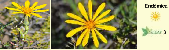
Mutisia retrorsa "mutisia"

Subarbusto glutinoso de unos 60 cm alt., muy hojoso en la base. Hojas enteras, verde-limón. Flores amarillas en capítulos radiados, grandes, que acumulan una resina pegajosa en el centro. Común en suelos arenosos.