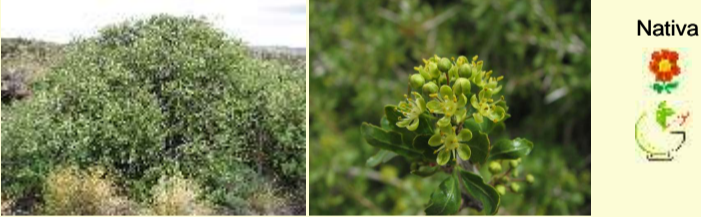
Familia Anacardiaceae Schinus molle "molle"

El Parque Nacional Laguna Blanca protege un sector representativo del ecosistema de la eco-región Estepa Patagónica y de los Altos Andes. Unas 325 especies de plantas vasculares habitan en el Área Protegida siendo el 90% nativas y el 10% son originarias de otros continentes. Unas 60 son exclusivas de la Argentina (endémicas), restringidas al sector andino austral.