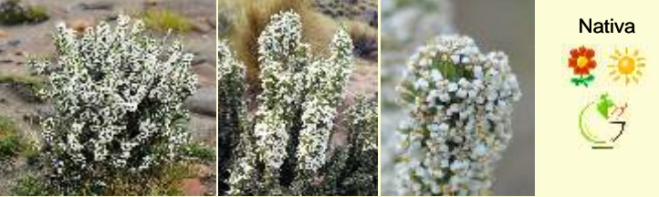
Nassauvia axillaris "uña de gato, calahuala"

Trepadora, con tallos angostamente alados. Hojas dentadas, verdebrillantes en el haz y plateadas en el envés con abundantes pelos tomentosos; terminadas en un zarcillo bifido. Flores amarillas en capítulos radiados, grandes. Común en las laderas del cerro Mellizo Sur, generalmente trepada a los neneos.