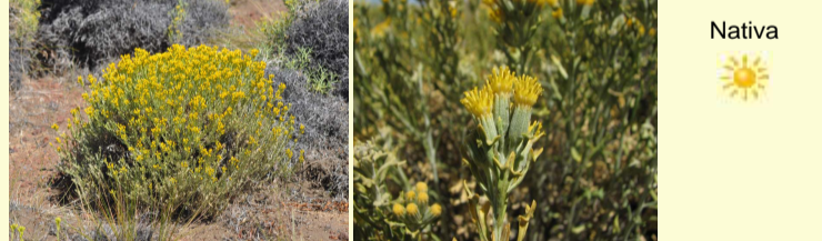
Senecio perezii "charcao"

Hierba perenne, rizomatosa, con hojas en rosetas grisáceas aplicadas al suelo, con protuberancias espiniformes oscuras. Flores amarillas en capítulos radiados, muy grandes en relación al tamaño de la planta, acaules. No es muy abundante, se la encuentra en la cumbre de los volcanes.