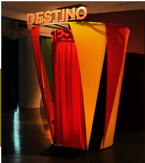
Graciela Taquini Destino ??? Instalación multimedia, 200 x 150 x 200 cm Gran Premio Adquisición Salón Nacional de Artes Visuales 2014