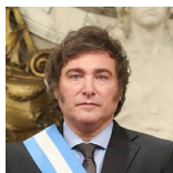
Presidente de la Nación Dr. Javier Milei