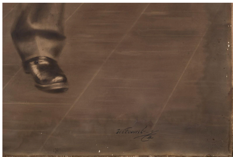
Imagen 6: Sector del anverso afectado por contacto directo con agua o humedad (corrimiento y oscurecimiento de material de retoque)