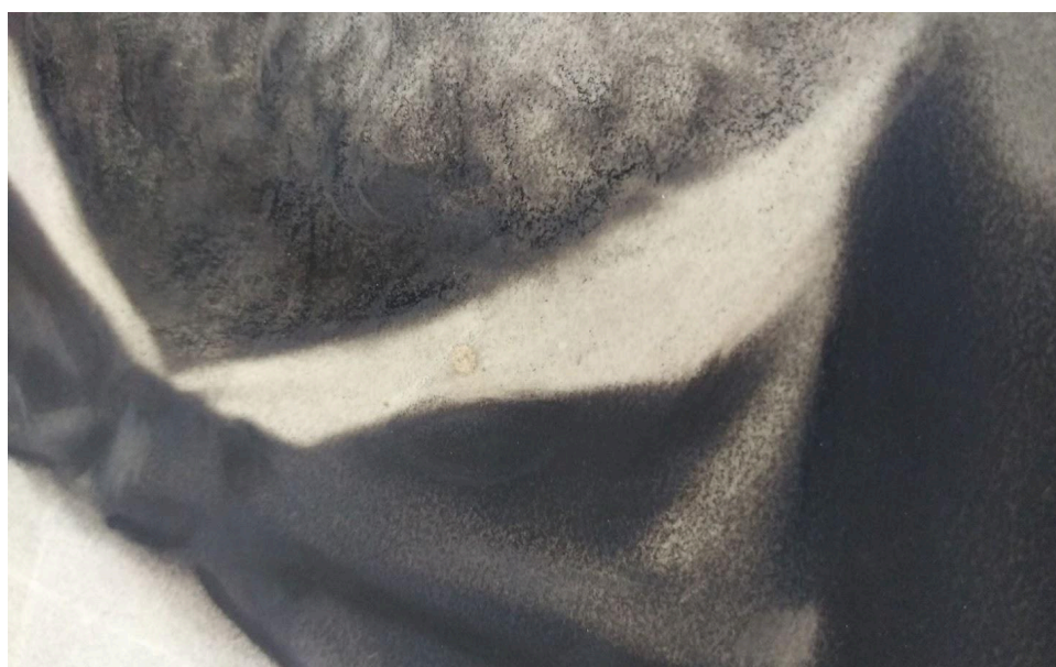
Imagen 4: Detalle de los retoques en barba y moño.

La posibilidad de obtener tamaños mayores apunta al posible motivo por el que la imagen fue retocada. Muchas veces, la definición y los contrastes se veían disminuidos. Por ello, era necesario corregir el resultado para obtener mejores contrastes y una mayor belleza estética en el producto final. La aplicación de retoques también puede tener orígenes ligados a gustos de la época y permite conocer características del trabajo de la casa ejecutora. La importancia y poderío del personaje retratado, sumado al contexto en que se tomó la fotografía, no hacen extraño el desarrollo de una pieza de notables características documentales y artísticas.