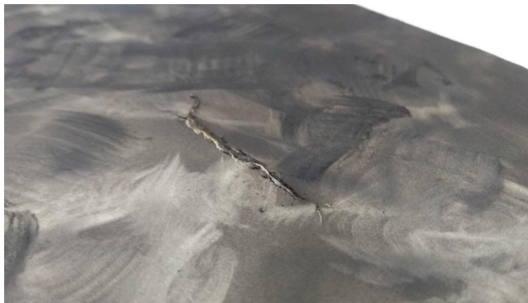
Imagen 5: Detalle de sector del anverso con rotura (sección izquierda superior).

Resultados de la observación: El estado de la fotografía era regular . Dicha calificación se obtuvo a partir del estudio de la profundidad, extensión e intensidad de los deterioros, obedeció a que el objeto presentaba afectaciones en aproximadamente el 50% de su superficie total. Tal porcentaje de daños genera problemáticas estructurales y morfológicas de importancia media. Sin embargo, no impiden su manipulación ya que los materiales de los que se compone la pieza disponen aún de estabilidad comprobable. La imagen se encuentra levemente obstruida, lo que afecta su lectura estética, pero tiene posibilidad de recuperación sin peligro de pérdida o modificación visual.