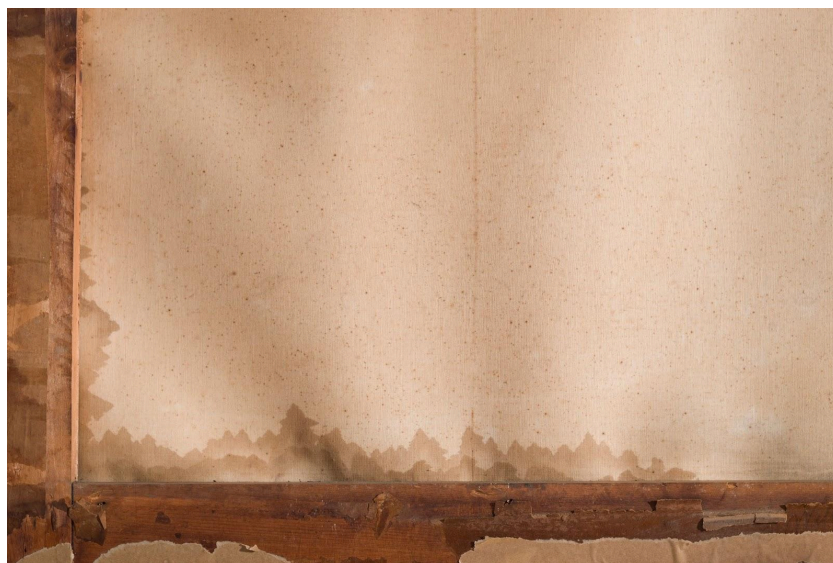
Imagen 7: Sector del reverso con manchas por contacto directo con agua o humedad. Allí se pronuncia la deformación planar (toma con iluminación rasante).