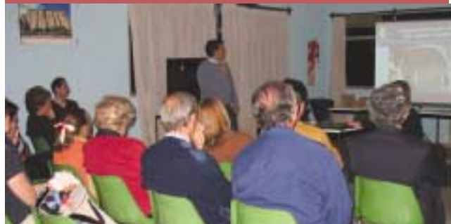
Capacitación a la población de Villa Rumipal, Provincia de Córdoba, sobre planes de emergencia