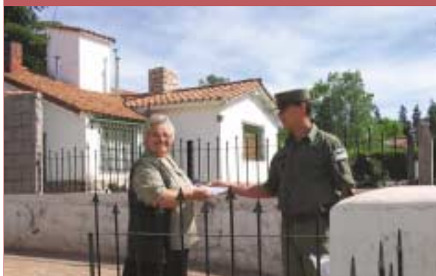
Gendarmería Nacional reparte pastillas de yodo a la población durante un simulacro de la Central Nuclear Embalse