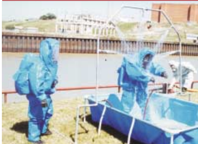
Personal interviniendo en un simulacro de emergencia equipado con traje autónomo.