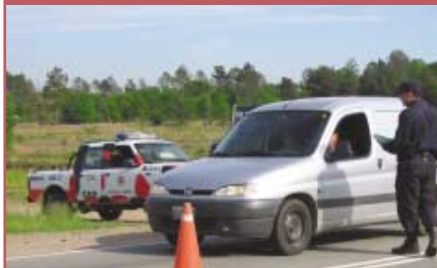
La Policía de la Provincia de Buenos Aires participa en el control de los accesos que se practican durante los simulacros.