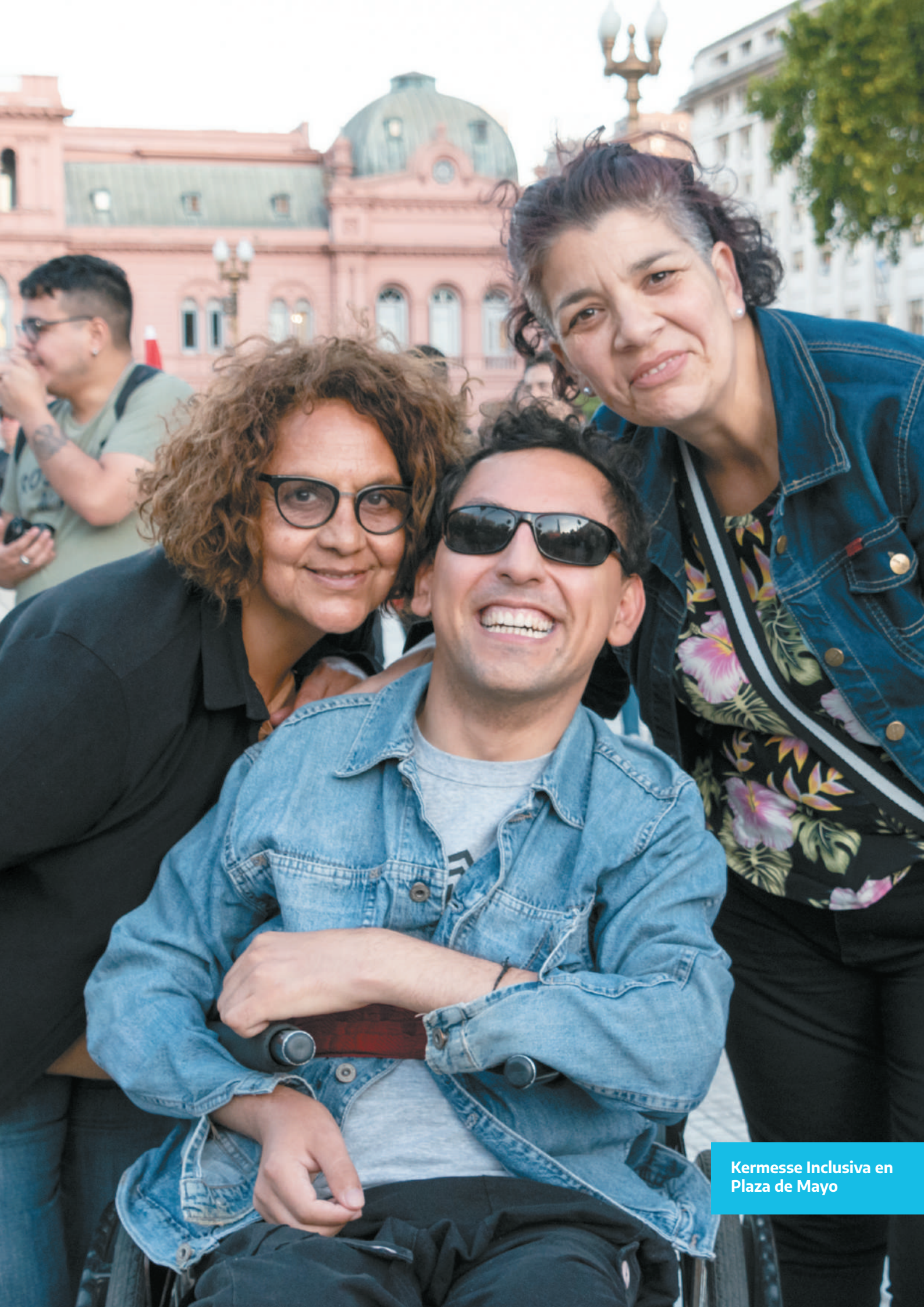
Kermesse Inclusiva en Plaza de Mayo