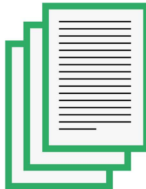
DETERMINACIÓN DE LA ANTIGÜEDAD