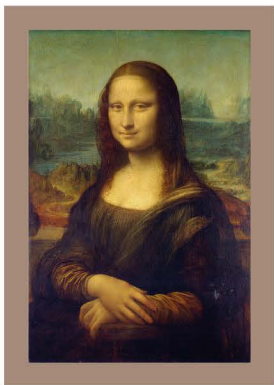
PRESERVACIÓN DE OBRAS DE ARTE

pautas sencillas para salvar los documentos sanos afectados por el agua y rescatar la información. Darles un tratamiento adecuado no solo es importante por su valor documental o afectivo, sino también porque los microorganismos que lo atacan son muy peligrosos para la salud humana .