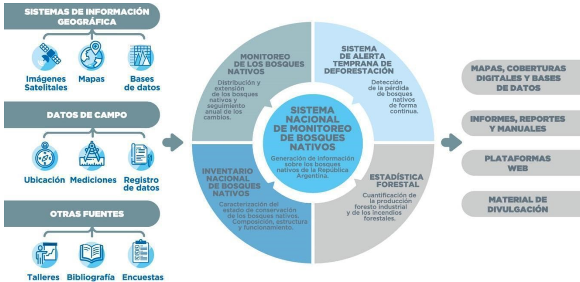
Ilustración 3. Sistema Nacional de Monitoreo de Bosques Nativos de la Argentina.