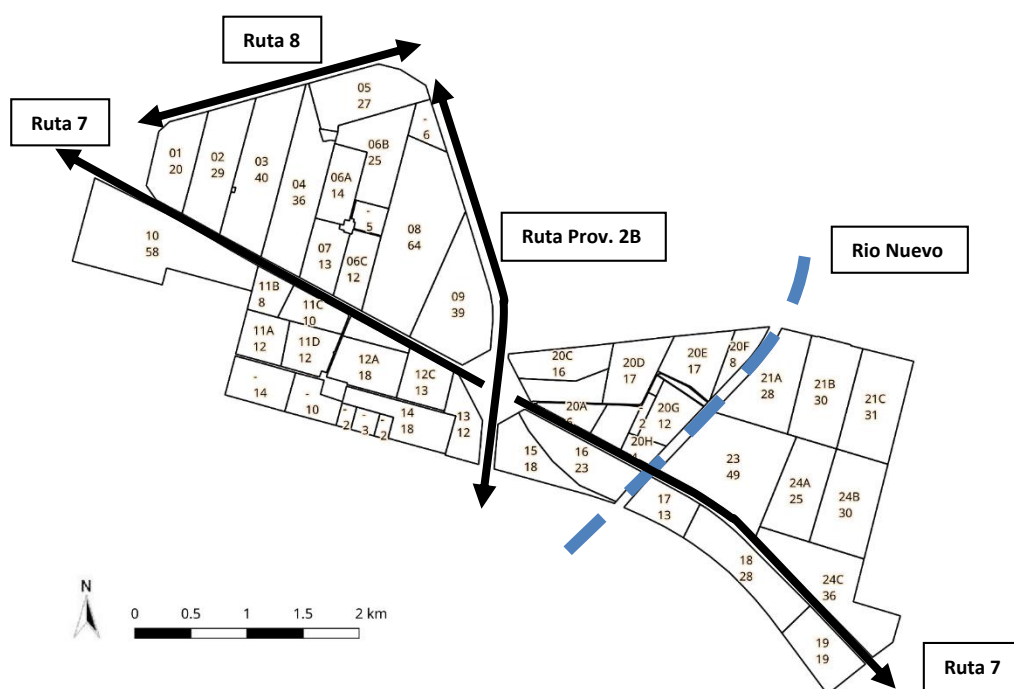
Imagen N° 2. Diagrama del Campo experimental de la EEA San Luis

Las cifras ubicadas dentro del perímetro de cada lote se corresponden con el siguiente orden: La superior con el N° de identificación asignado a cada uno y la inferior a su correspondiente superficie. https://qgiscloud.com/jpmartini/CampoINTA_WEB/?bl=ocm_landscape&l=Campo-INTA-UTM19S&t=CampoINTA_WEB&e=-7288891%2C-3988059%2C-7271958%2C-3979603