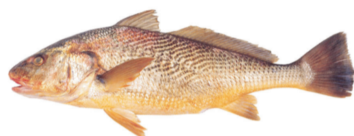
Corvina rubia o blanca Whitemouth croaker Micropogonias furnieri