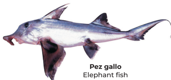
Pez gallo Elephant fish Callorhynchus callorhynchus