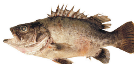
Chernia Wreckfish Polyprion americanus