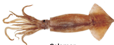
Calamar Argentine shortfin squid Illex argentinus