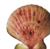
Vieira tehuelche Tehuelche scallop Aequipecten tehuelchus