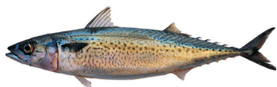
Caballa o Magret Atlantic Chub mackerel Scomber colias