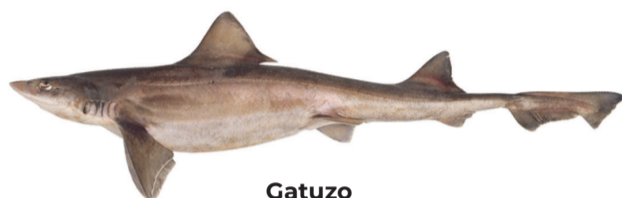
Gatuzo Patagonian Smooth Hound Mustelus schmitti