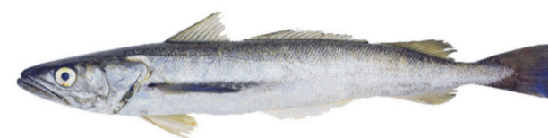
Merluza común o hubbsi o argentina Argentine hake Merluccius hubbsi