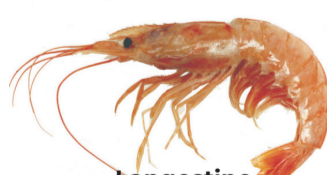
Langostino Argentine red shrimp Pleoticus muelleri