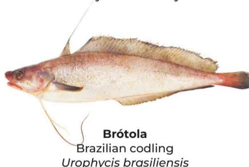
Brótola Brazilian codling Urophycis brasiliensis