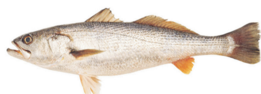
Pescadilla de red Stripped weakfish Cynoscion guatucupa