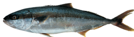
Pez limón Yellowtail kingfish Seriola lalandi