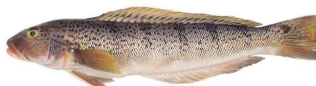
Salmón de mar Argentiniansandperch Pseudoperca semifasciata