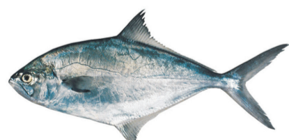
Palometa pintada Parona leatherjack Parona signata