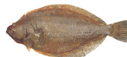
Lenguado Flounder Paralichthys patagonicus