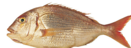
Besugo Red porgy Pagrus pagrus