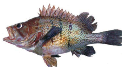
Mero Argentine seabass Acanthistius patachonicus