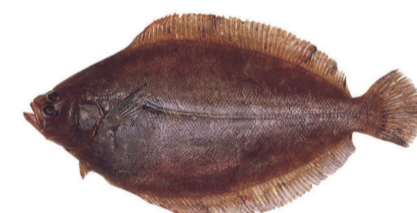
Lenguado Flounder Xystreureys rasilis