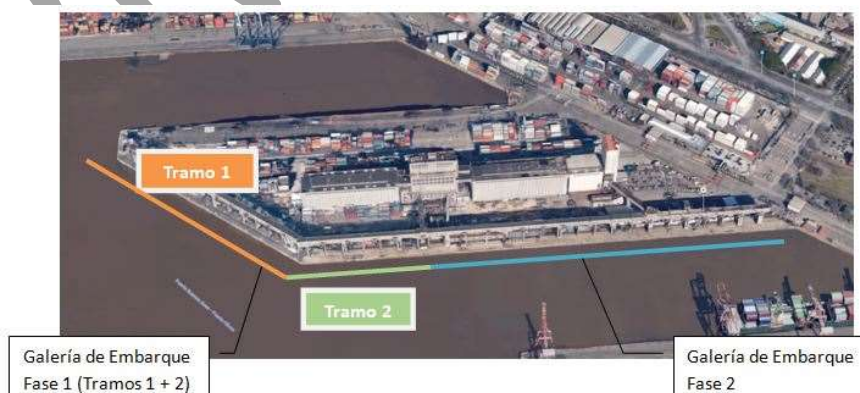
Figura 1: Vista General de las fases de ejecución

Estos tramos están compuestos por una galería de hormigón armado cuya losa de piso está situada a aproximadamente 21 m de altura, apoyada sobre columnas del mismo material. La galería tiene unas medidas, en la mitad del desarrollo, comenzando desde el Sur de 4 m de altura por 6 m de ancho, mientras que en los 130 m situados hacia el Norte y en todo el Tramo 2 cuenta con dos galerías superpuestas de la misma medida. Para este último sector presenta 9 m de altura por 6 m de ancho.